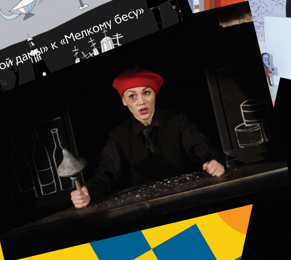
«Театральный фургончик» готовится в путь