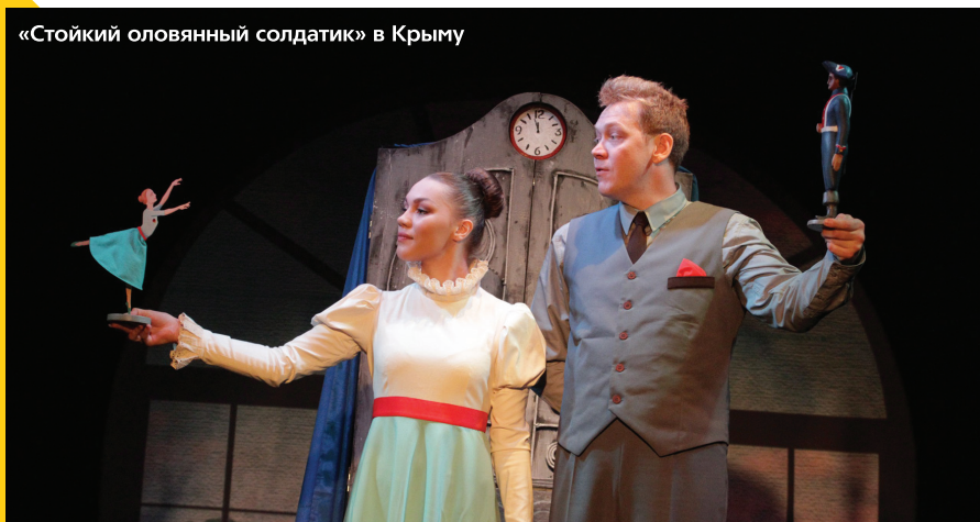
«Стойкий оловянный солдатик» в Крыму

Гастроли состоялись при поддержке Федерального центра поддержки гастрольной деятельности и министерства культуры Красноярского края.