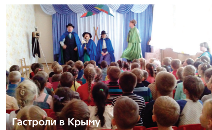
Гастроли в Крыму