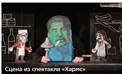
Сцена из спектакля «Хармс»

оказывается персонажем вневременным. Переступая через плоских Пушкиных-Гоголей-Достоевских и всех прочих, знакомых нам гениев русской литературы века XIX, он не спотыкается – выныривает сразу в век XXI-ый. И ему здесь легко-легко. Комфортно. Это – его пространство, здесь, как нигде и никогда, действуют Хармсы-законы: абсурд правит миром – улыбайтесь, господа.