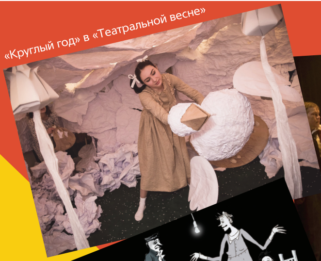
«Круглый год» в «Театральной весне»