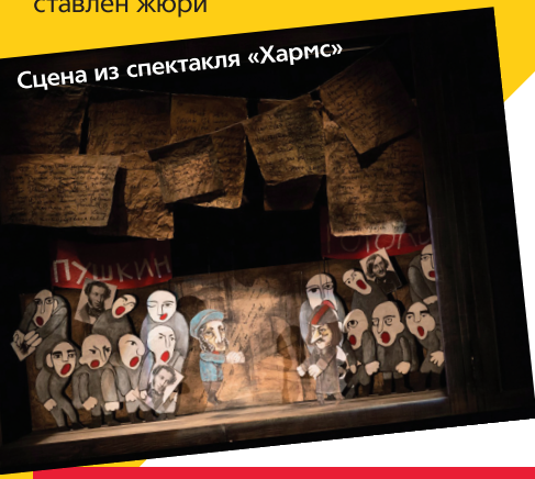
Сцена из спектакля «Хармс»

Еще один спектакль Красноярского театра кукол – «Иван Царевич и Серый волк» (режиссер Александр Хромов) – вошел в лонг-лист «Золотой маски», где представлены лучшие спектакли страны прошлого творческого сезона.